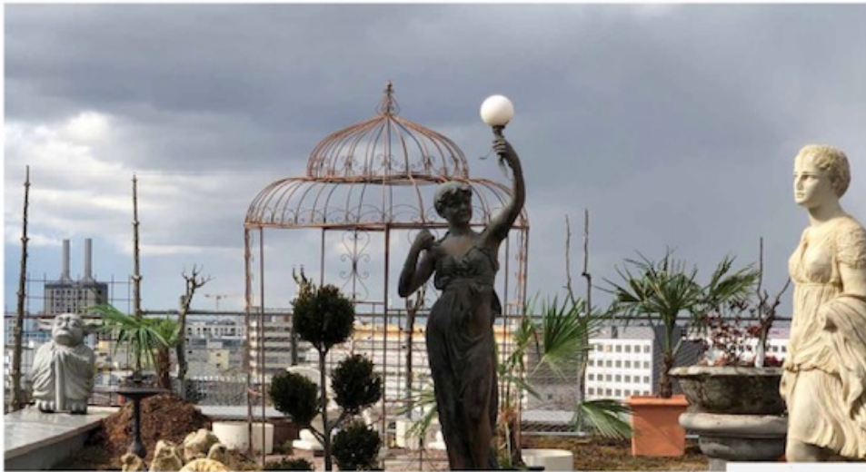
APHRODITE & ATHENE