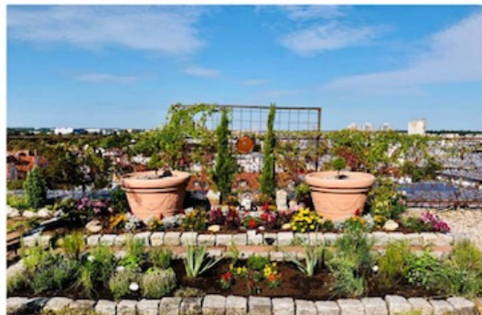
KLOSTERGARTEN & GRABMAL DER CANDEN