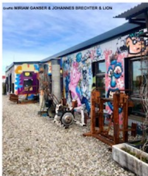
FAVELA / SPALIER DER GLADIATOREN